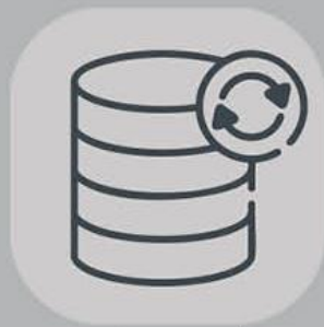
Database Backup Service