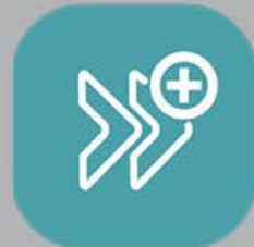
Multi Use Button